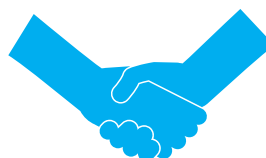
Cam kết chất lượng